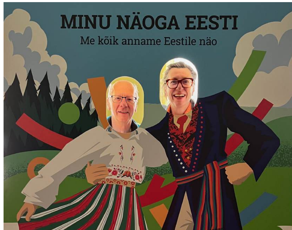
Minu näoga eesti – Estland mit meinem Gesicht

https://www.klein-co.world/ www.instagram.com/ulrikeundguentherjuergen.klein