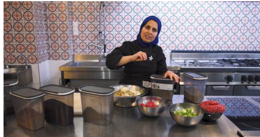
KITCHEN STORIES 4x5 min video, 4K, 16:9 2026