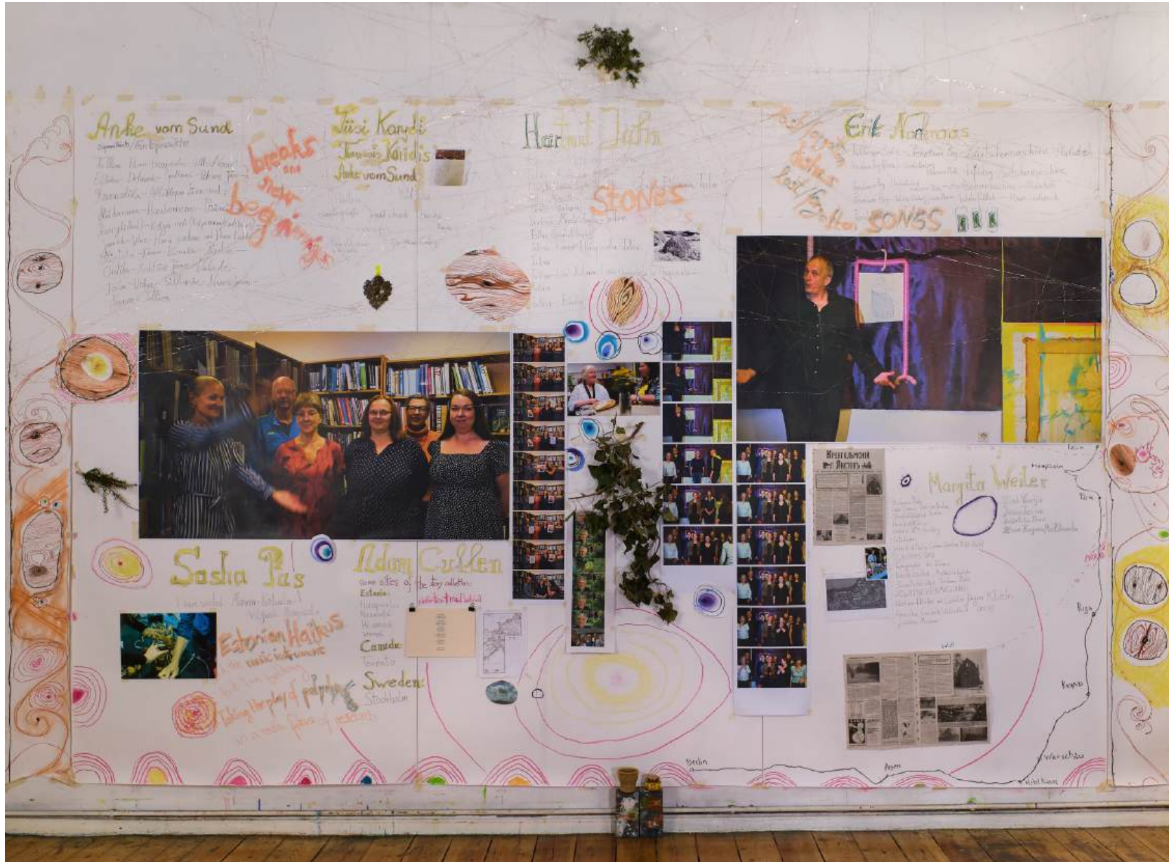
Wandskizze mit den Begegnungen, Orten und Vorhaben der KünstlerInnen-Tandems und des Partner-Teams Versch. Materialien/Papier/ 300x510 cm