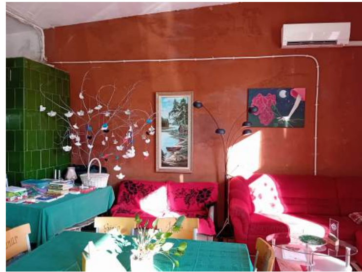
3 Fotografien aus der Serie „Martna community cafe run by preestess Küllike Valk“