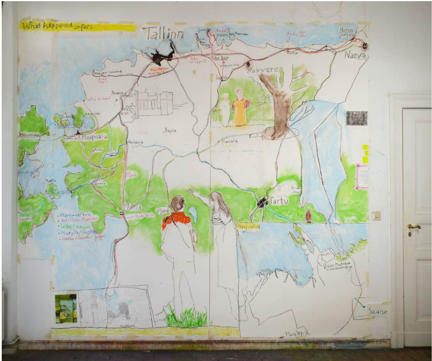
Landkartenskizze mit den Reiserouten der Teiste-Lood-KünstlerInnen in Estland Kreidestifte/Photographien/Papier 2026/ 300x330cm